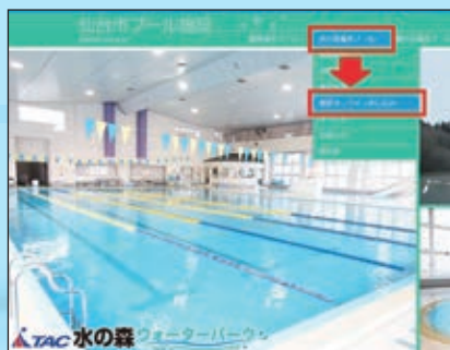
「水の森温水プール」で検索!

① TAC水の森 ウォーターパーク ホームページ画面より「教室オンライン申し込み」をクリック