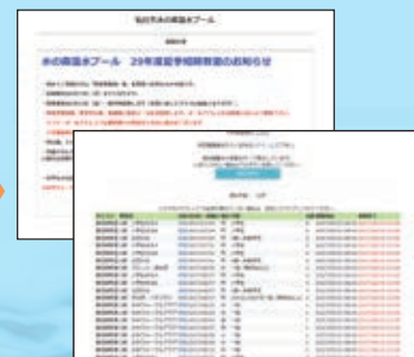
登録メールアドレスに応募完了メールが届きます。