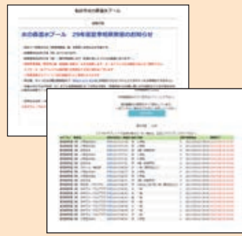
登録メールアドレスに応募完了メールが届きます。