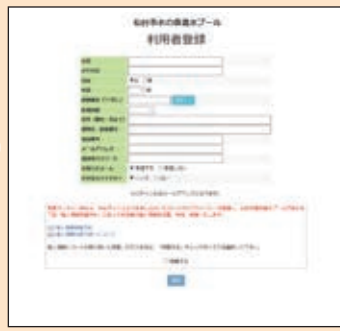
登録メールアドレスに登録完了メールが届きます。