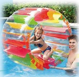
ウォーターホイール